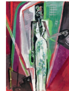
Jacques Henri Lartigue (1894-1986) Sans-titre Non daté Gouache sur papier