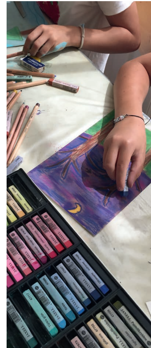
Ateliers du musée d'Art et d'Histoire Louis-Senleque - 2018

Les animations pour enfants et familles proposées par le musée sont labellisées « Val-d'Oise Family » par Val-d'Oise Tourisme.